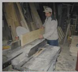
LE FORME DEL LEGNO Un artigiano salentino

supporti documentali che riportano le professioni di entrambi i sessi.